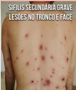
SÍFILIS SECUNDÁRIA GRAVE LESÕES NO TRONCO E FACE